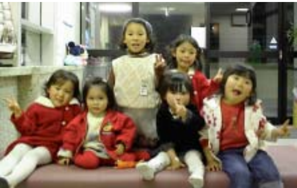
今月の顔（今回は6人登場！） 4人姉妹+2人姉妹は"いとこ"どうし。 おばあちゃんはたいへんだ。！！！！

駐車場について 月山病院小児科では駐車場は道をはさんで向かいの大岩駐車場を利用していただいておりますが、満車の時が多く御迷惑をおかけしております。鋭意努力中ですが、満車時は受付でお声（電話でも）をかけていただければ、できるかぎり他の駐車場を御紹介いたします。