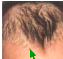
赤ちゃんのニキビ 頭皮内のかさぶた