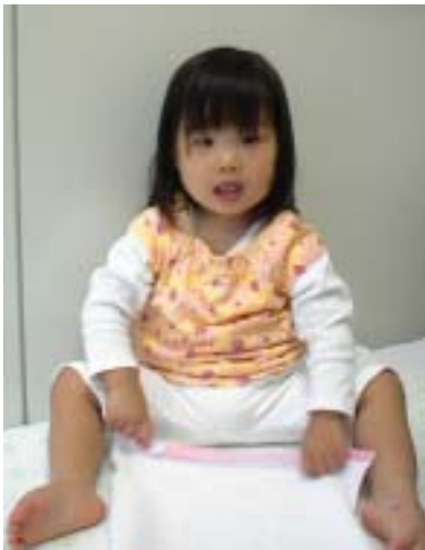
今月の顔 裕香ちゃん ぼう然かな？